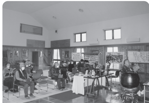
12月11日 ともしび説法(心光寺本堂)

アバヤ王子は早速に竹林精舎を訪ね、翌日の食事にお釈迦様を招待して帰りました。翌日お釈迦様は王子の家に行つて供養を受けられ、食後に問答が始められた。王子は「世尊よ、如来は他人が愛せず好まないような言葉を発することがありますか」と問うと、「王子よ、それは一概に言えぬ」と答えられました。王子はイエスカノーかの返事だけしか期待していなかったため、別の返事にうろたえ窮してしまいます。合掌 (奥原豊龍)